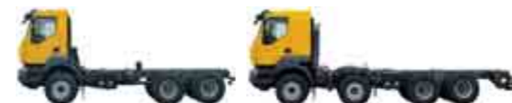
Renault Kerax 6 x 4